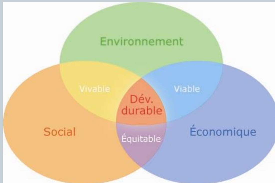
Schéma du développement durable